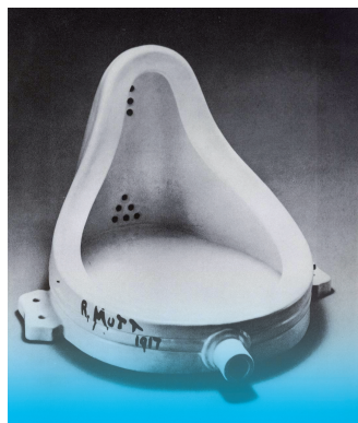
Heute nicht mehr lustig: Marcel Duchamps Jahrhunderscherz (1917).

Wir finden: Schluss mit diesem Unsinn! Jetzt, wo es ernst gilt, können wir uns einen solchen Luxus nicht mehr leisten!